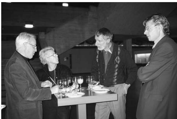
Small Talk beim Apéro